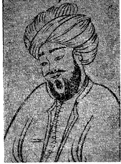
Molla Hüsrev'in minyatürü (Şakâ-yık-ı Nûmâniye'den) (Meşhur Türk Hukukçuları isimli eserden alınmıştır)